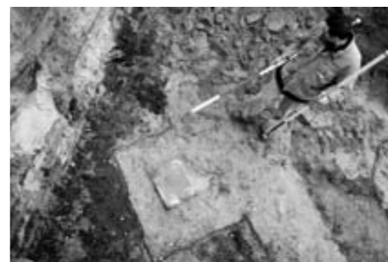
Oude boogmuren tussen de betonnen poeren van de gesloopte Dullertflat