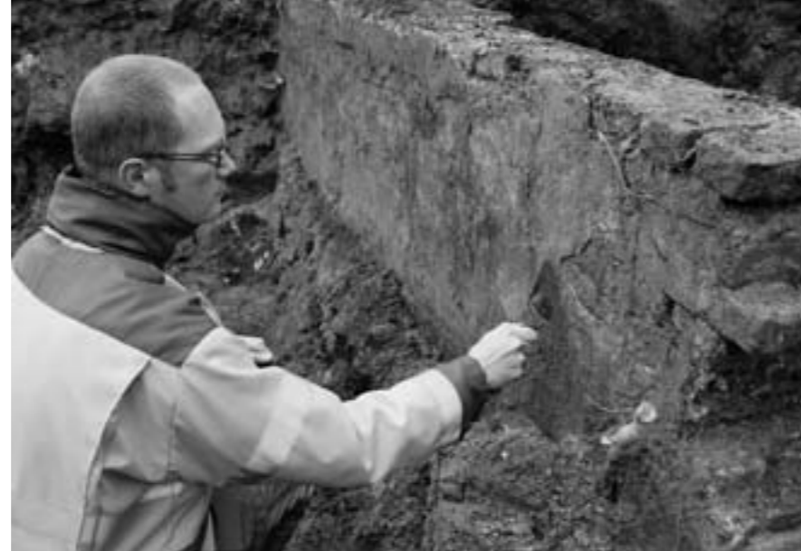
De zware kademuur waar ooit de Molenbeek langs stroomde

Een meter verder is de muur blootgelegd van het gebouw waar naar werd gezocht: de graanschuur die later is genoemd naar de 19e-eeuwse eigenaar Dullert. Naast deze muur maakt Kasper de bodem van een put voor de opslag van regenwater zichtbaar. De put zelf is lang geleden afgebroken, de bakstenen zijn destijds vanwege de hoge prijs opnieuw gebruikt.