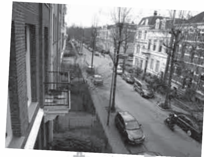
Foto 2 vanaf balkon Parkstraat 66 in maart 2010

Foto 1 van de Parkstraat, omstreeks 1880, met rechts een deel van landgoed Gelders Spijker, foto uit het archief van Arnhem.