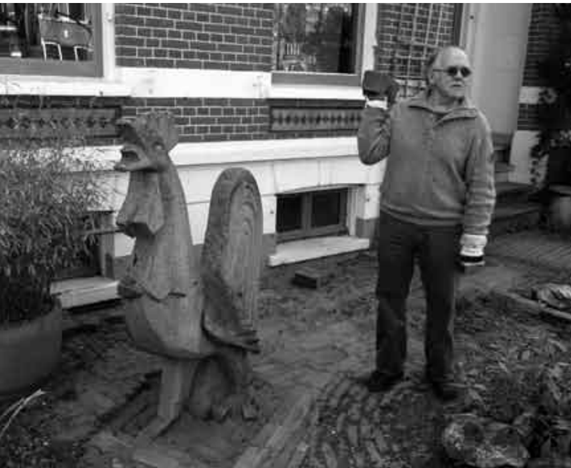
Om de haan te vervoeren was een flinke vrachtwagen nodig

Eén van de twee granieten hanen die ooit het gebouw van Het Vrije Volk en de Geldlander aan het Gele Rijdersplein tooiden, is verzeild geraakt in de voortuin van een bewoner aan de Boulevard Heuvelink. Daar, naast garage Zijm, staat het stenen beest sinds 9 april. Dat is te danken aan het feit dat het pand De Opbouw aan de Velperweg, ooit met bewoners als NVV, FNV en Nivon 'het rode bastion' genoemd, sinds kort is verlaten door de Stichting Rijnstad.