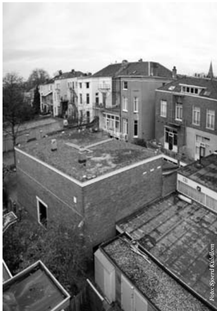
De 'toneeltoren' van het theater tussen de woningen, gezien vanaf de flat in de Dijkstraat.