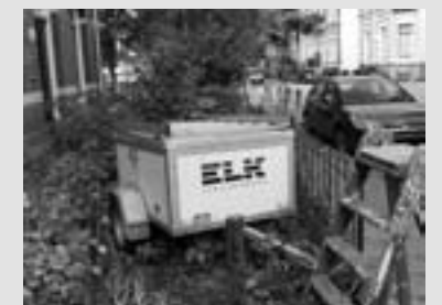
Een aanhanger wordt midden in de tuin geparkeerd