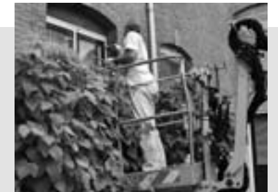
Een schilder wringt zich door de beplanting