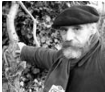
Kassiël bij de tweestijlige meidoorn (Crataegus laevigata)