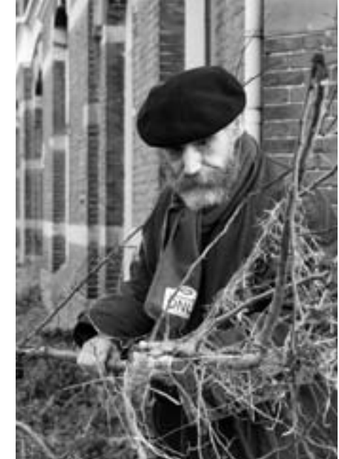
Kassiël toont de afgebroken takken

Hieronder de brief die hij de redactie van de wijkkrant stuurde.