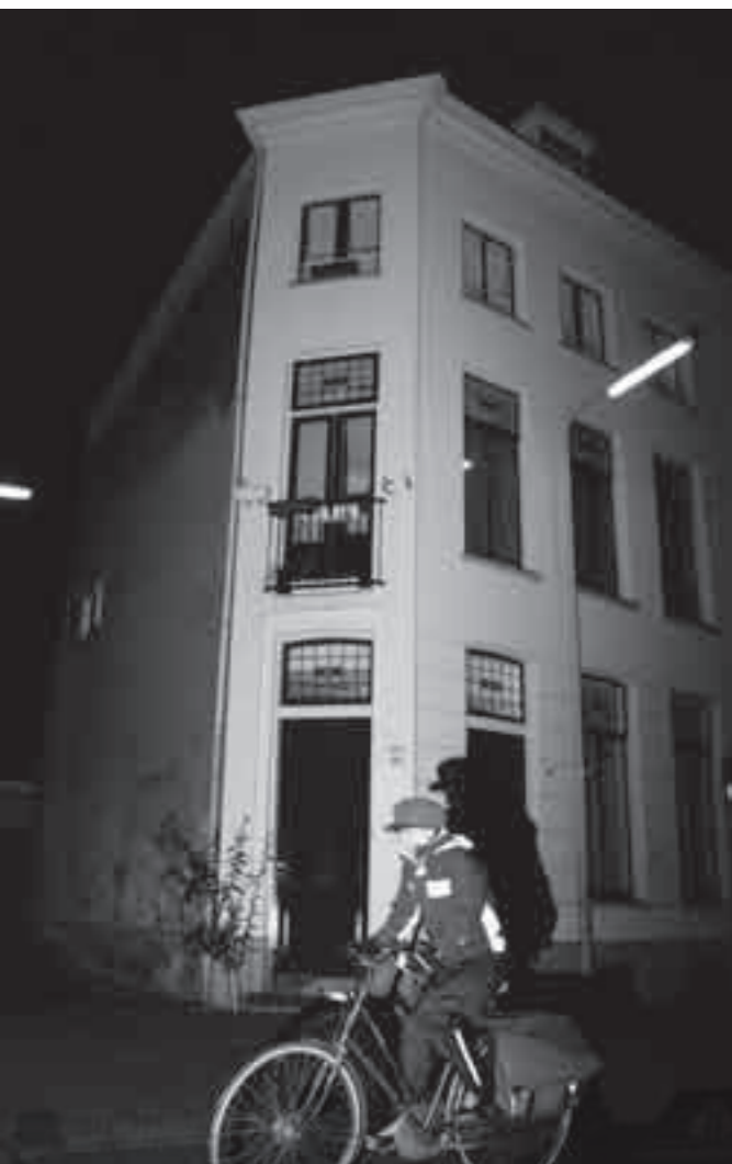
Pand Spijkerstraat 187