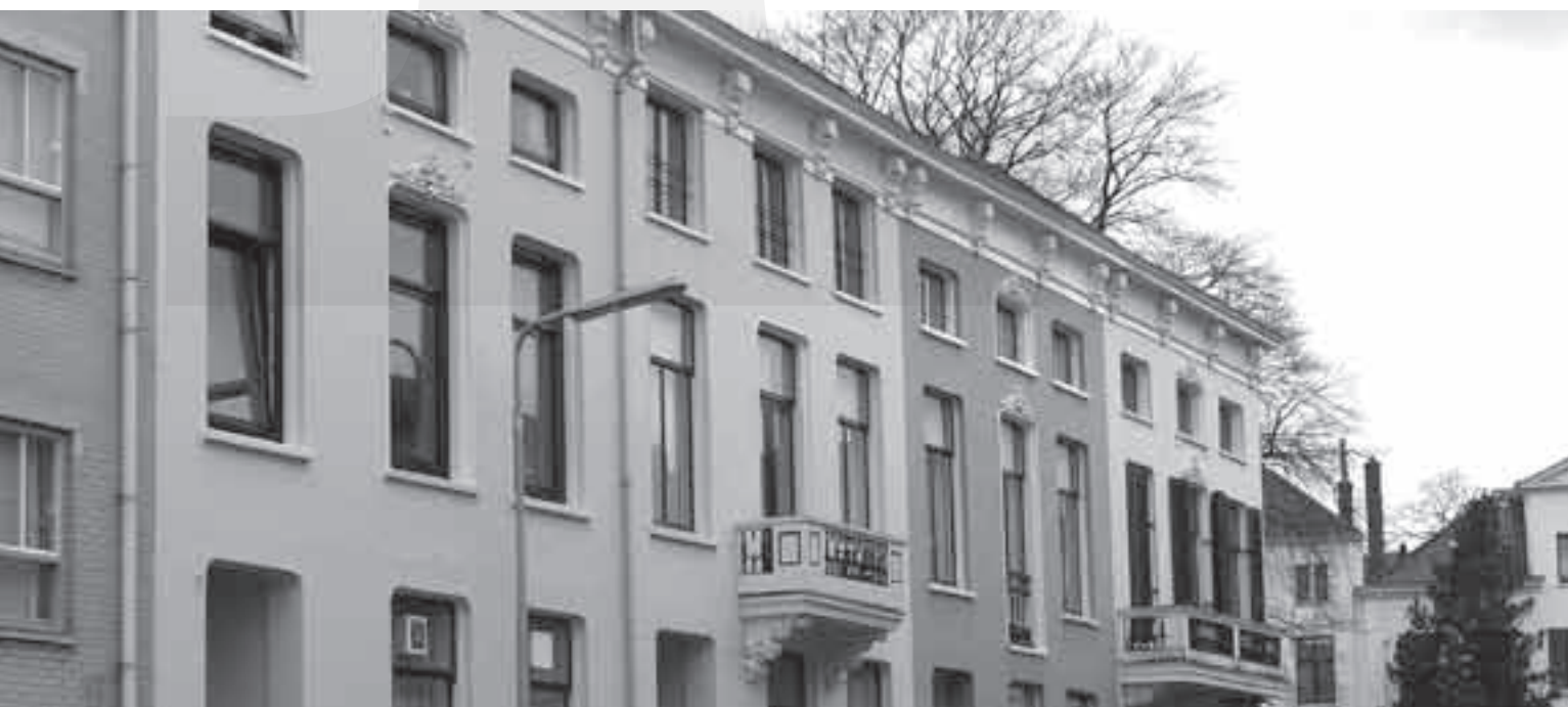
Een rijtje panden met mezzanines.