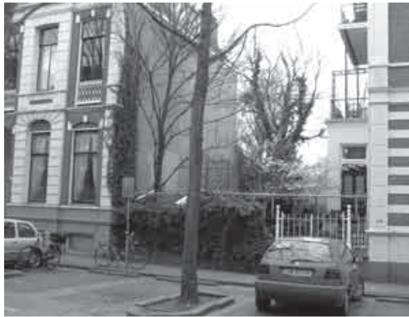
Een van de vele doorzichten naar een achterterrein in het Spijkerkwartier.