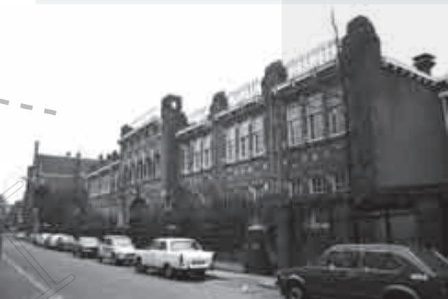
De Schoolstraat in 1976

In 1863 trad in werking de Wet op het Middelbaar Onderwijs, die een nieuwe omvattende regeling van het voortgezet onderwijs bevatte. Johan Thorbecke als verantwoordelijk minister van Binnenlandse Zaken schiep daarmee een heel nieuwe onderwijsvorm: de Hogere Burger School (HBS). Aanleiding voor de gemeente Arnhem om een nieuwe school te laten bouwen aan het Willemsplein, waarin in 1866 de gemeente-HBS werd gehuisvest. Zie ook de vorige aflevering (nr 25) van dit feuilleton. Het HBS-