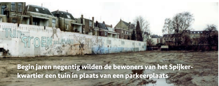
Begin jaren negentig wilden de bewoners van het Spijkerkwartier een tuin in plaats van een parkeerplaats

En daarmee is een start gemaakt met een schitterende serie groene oases in het ooit zo rode Spijkerkwartier. We nemen u graag mee op excursie.