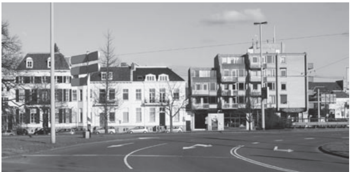
Hoek Eusebius- buitensingel en Boulevard Heu- velink